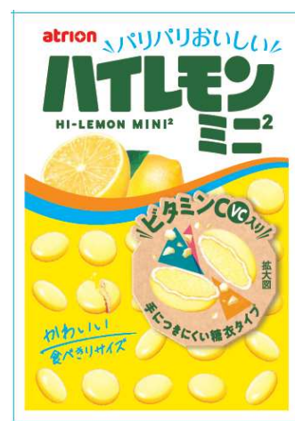
手に取りやすい小容量サイズ“ハイレモンミニ²”