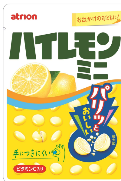
パリっとおいしい“ハイレモンミニ”