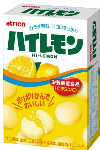
1980年発売の“18粒ハイレモン”